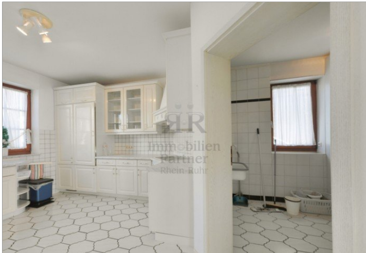
Küche + Zugang HWR