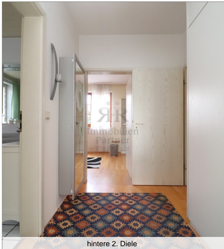
hintere 2. Diele