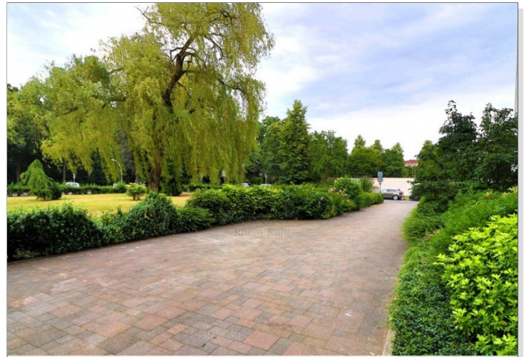
Vor der Haustüre