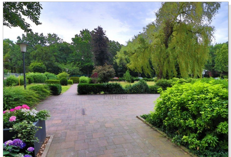
Vor der Haustüre