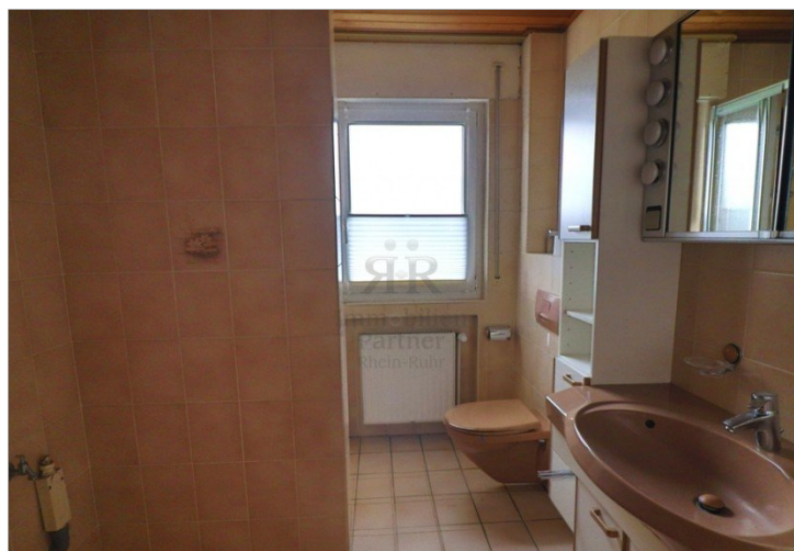
Bad mit Waschmaschinenanschluss