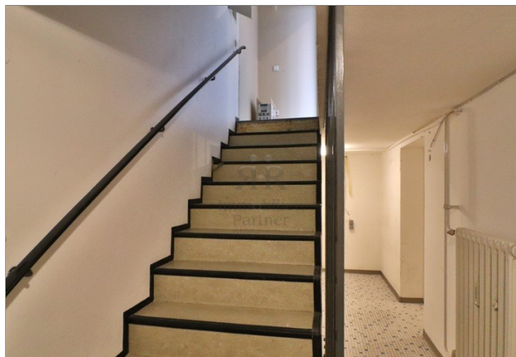
Treppe zum Keller