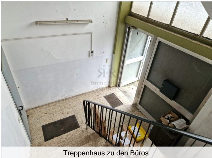
Treppenhaus zu den Büros