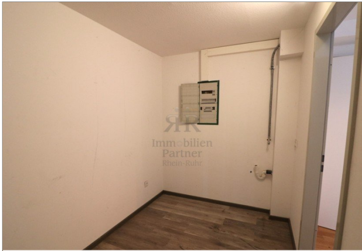
Abstellraum mit Waschmaschinenanschluss