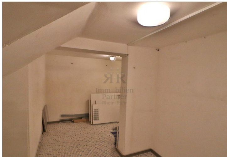
Keller / Lager