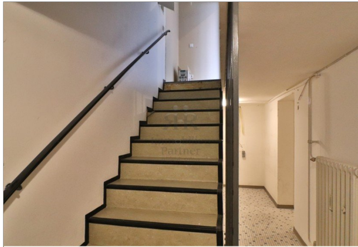
Treppe zum Keller