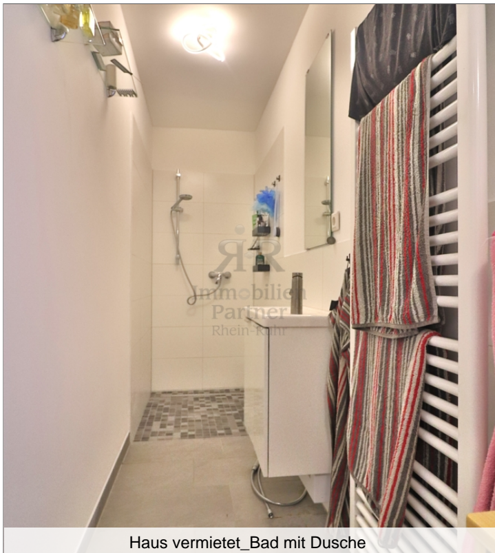
Haus vermietet_Bad mit Dusche