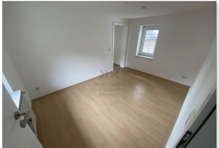
Haus vermietet - OG Raum 1