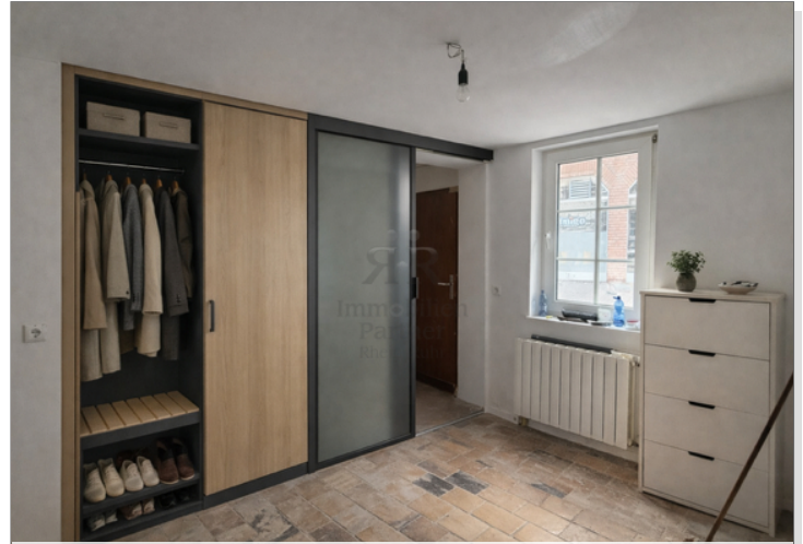
KI-Beispielbild als Inspiration_Dielenbereich