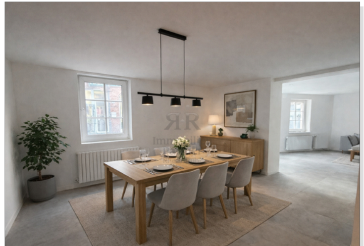
KI-Beispielbild als Inspiration_Essbereich + Zugang Wohnzimmer