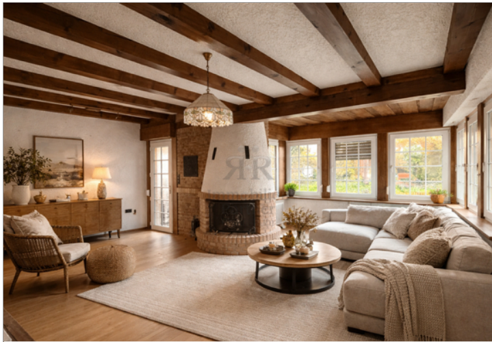
KI-Beispielbild als Inspiration_Kaminzimmer