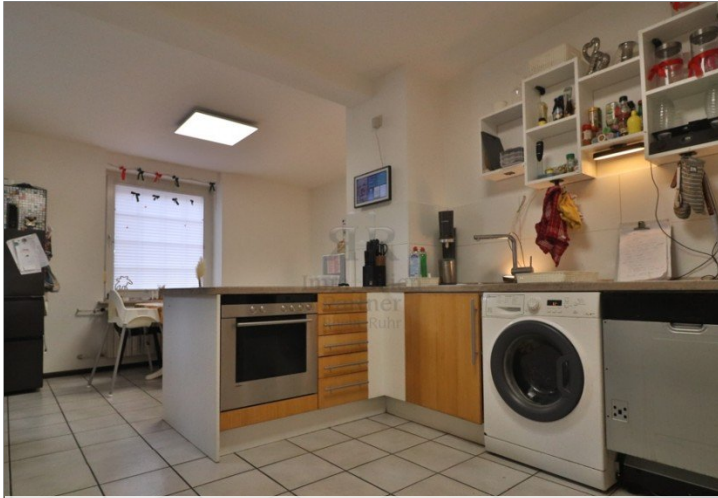
Haus vermietet -Küche