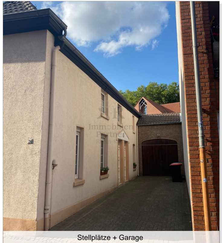
Stellplätze + Garage