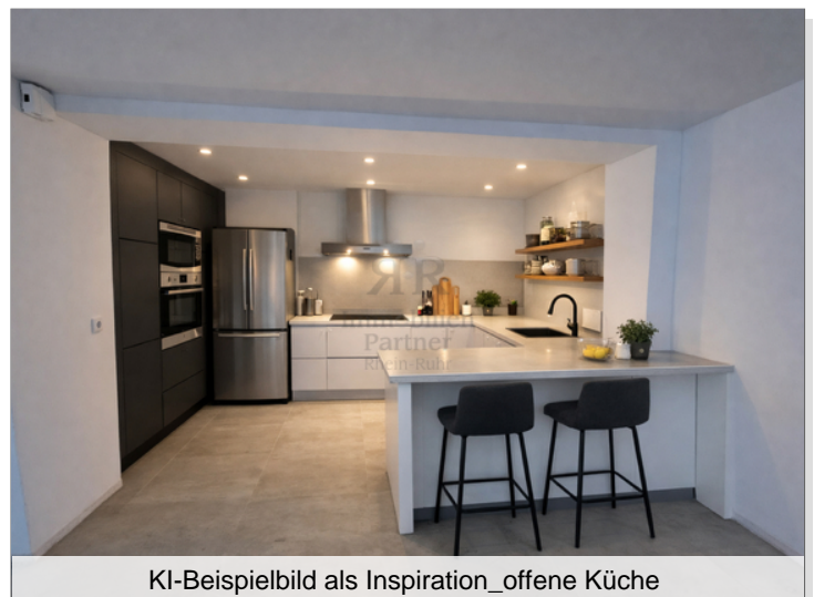
KI-Beispielbild als Inspiration_offene Küche