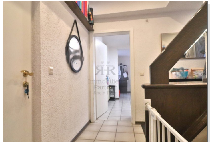
Haus vermietet_Diele EG