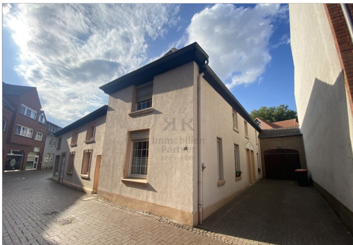
Außen-Seitenansicht mit Stellplätzen