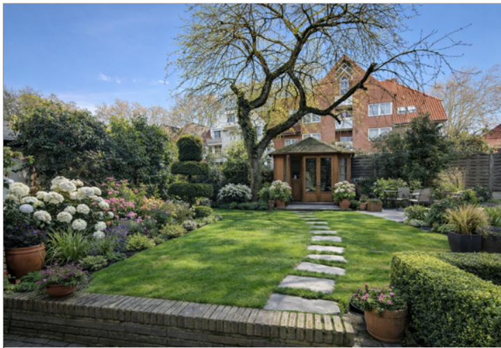
KI-Beispielbild als Inspiration_Garten