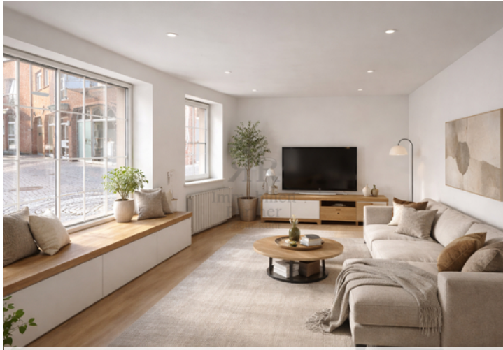
KI-Beispielbild als Inspiration_vorderes Wohnzimmer