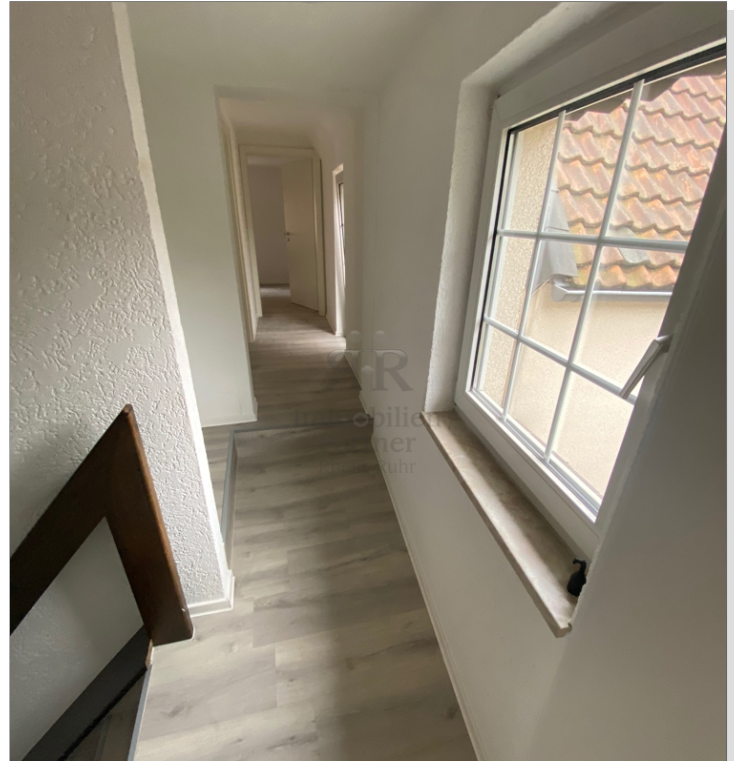
Haus vermietet_Diele OG