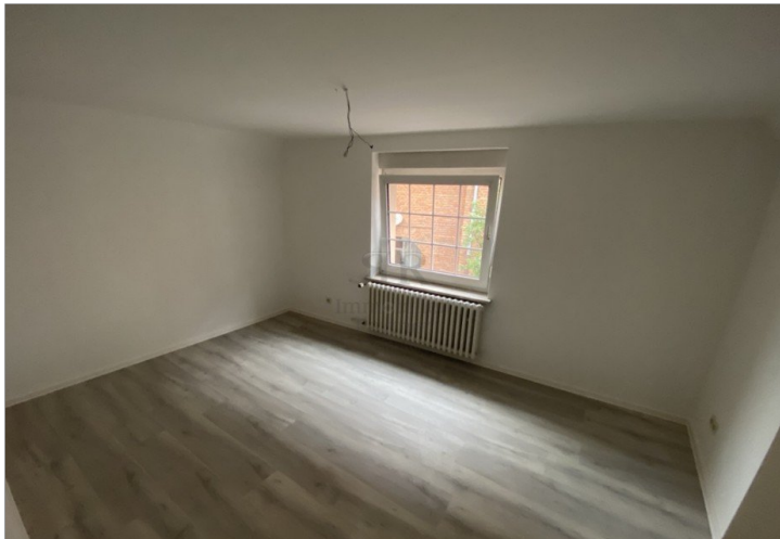
Haus vermietet - OG Raum 4