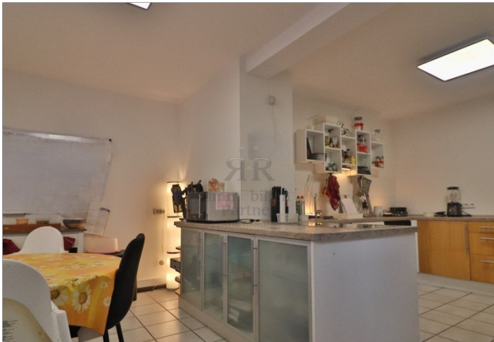
Haus vermietet - Küche mit Essbereich