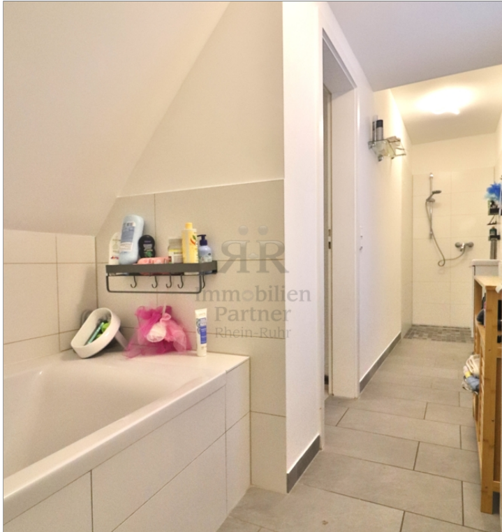
Haus vermietet_Bad mit Wanne + Dusche