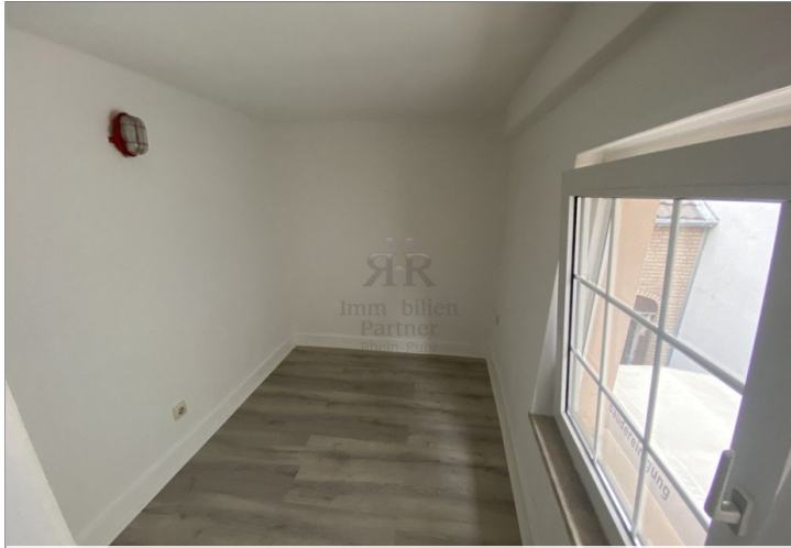
Haus vermietet - OG Raum 3