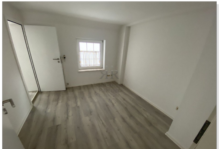
Haus vermietet - OG Raum 2